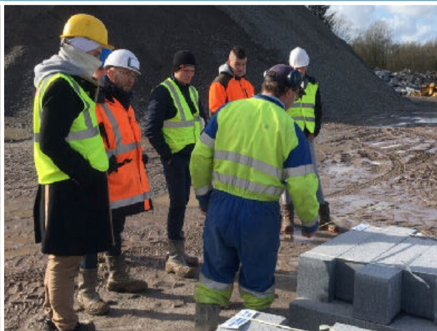
Visites et rencontres professionnelles