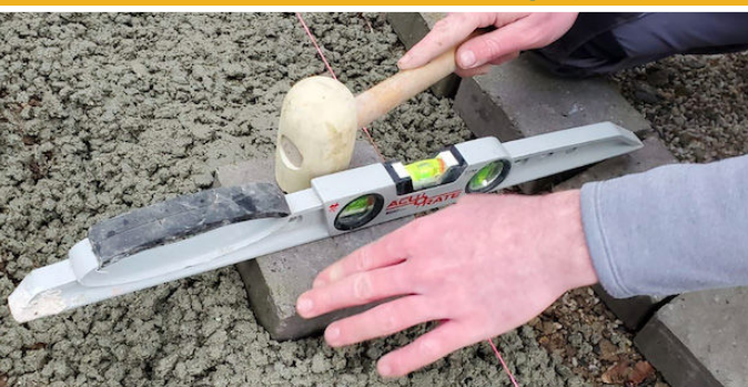
Utilisation d'outils et d'engins de chantier