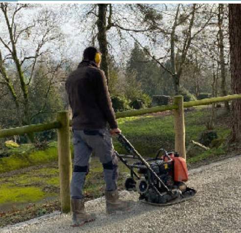
Conduite de chantiers pédagogiques